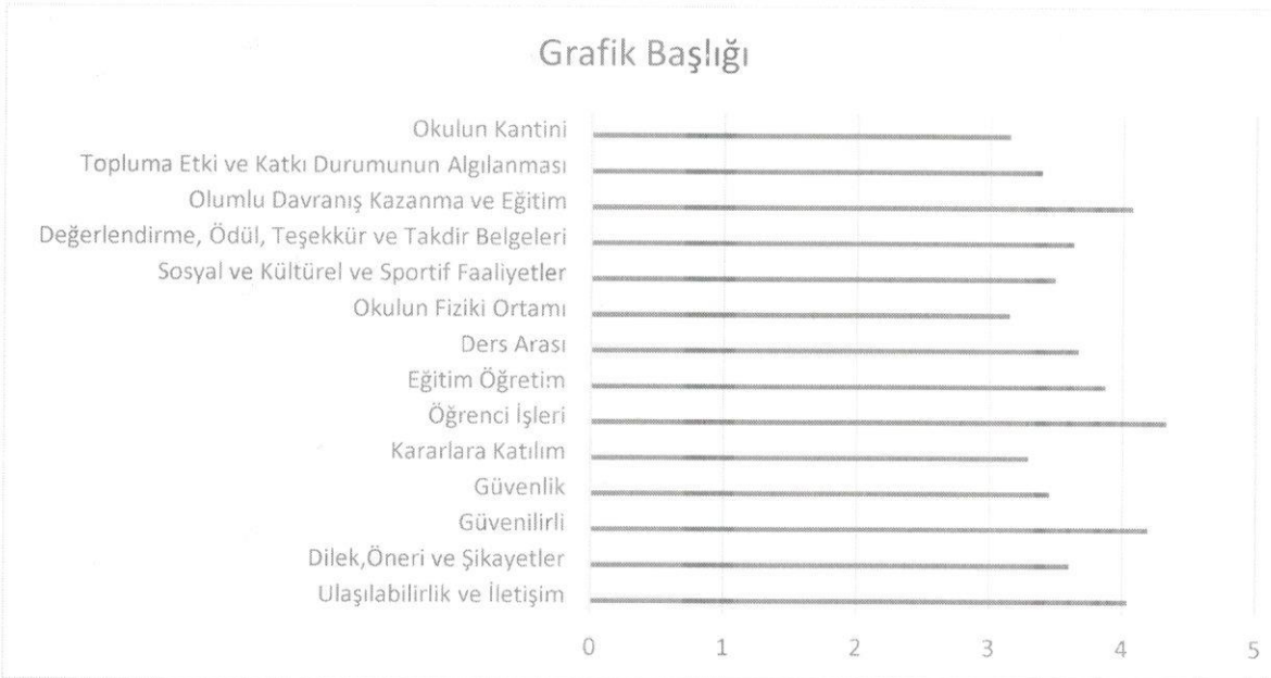
Şekil 2: Velilerin puanlarının konu başlıklarına göre çubuk grafiğinde gösterimi.